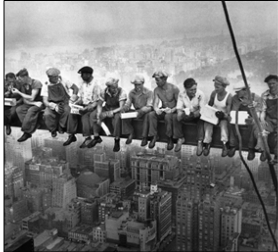
Foto: Charles C. Ebbets (1932). Construction Workers lunching on a crossbeam.

Temari: Les avantguardes històriques i la seva repercussió en la fotografia. El trànsit del pictorialisme al purisme: la Straight photography . La fotografia de l'època de la República de Weimar. La nova objectivitat . La Bauhaus, la nova visió . El fotomuntatge. El surrealisme. Object trouvé i fotografia. El retrat: tendències i principals característiques i autors. L'Alemanya dels anys '20 i el naixement del fotoperiodisme. La Farm Security Administration i el reportatge americà dels anys '20 i '30. L'humanisme francès. La fotografia després de la II Guerra Mundial, la fotografia subjectiva, la fotografia abstracta, expressionisme abstracte, el mestissatge entre estètica europea i nord-americana.