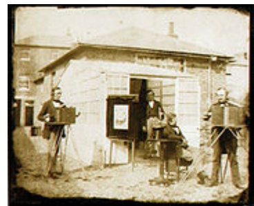
William Fox Talbot, 1853

Objectiu: Donar a conèixer els principals esdeveniments, tècniques i procediments fotogràfics del segle XIX. Donar suport conceptual i històric a la resta de les assignatures i les eines per que l'alumne tingui tant una visió crítica com objectiva de la història de la fotografia.