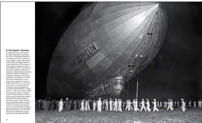
El Graf Zeppelin a Barcelona El dirigible alemany Graf Zeppelin, propietari de la línia de vols aèries de l'1929, va arribar a Barcelona el 27 de setembre de 1930. El dirigible va ser el primer a arribar a Catalunya. El Graf Zeppelin, després de diversos intents fallits, va aconseguir aterrar al camp de futbol de Sant Joan de Vilatorrada. La gent de Barcelona va acudir a veure el dirigible fins a mitja nit. El dirigible va ser el primer a arribar a Catalunya. El dirigible va ser el primer a arribar a Catalunya. El dirigible va ser el primer a arribar a Catalunya.