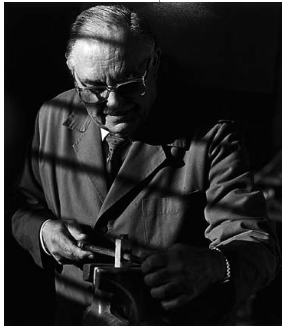
"El meu pare"