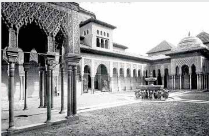
El Patio de los Leones, postal de 'Joyas de España'.

RECIENTE DE GRANADA A TRAVÉS DE LAS PÁGINAS DE IDEAL