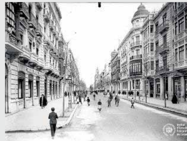
La Gran Vía, a la izquierda, el Gran Hotel París.