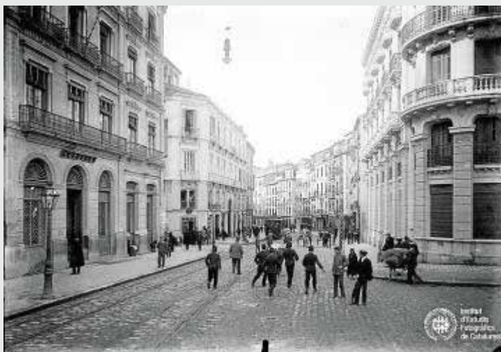
Reyes Católicos, a la izquierda, la antigua casa de Correos. :: IEFEC

lavar las sábanas en el cauce del Genil o del bullicio de los jardines del Triunfo.