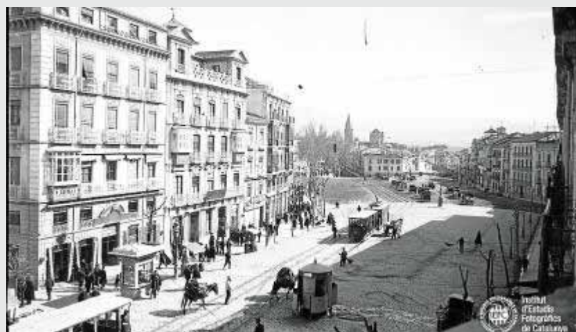
Tranvías circulan por la Acera del Casino.