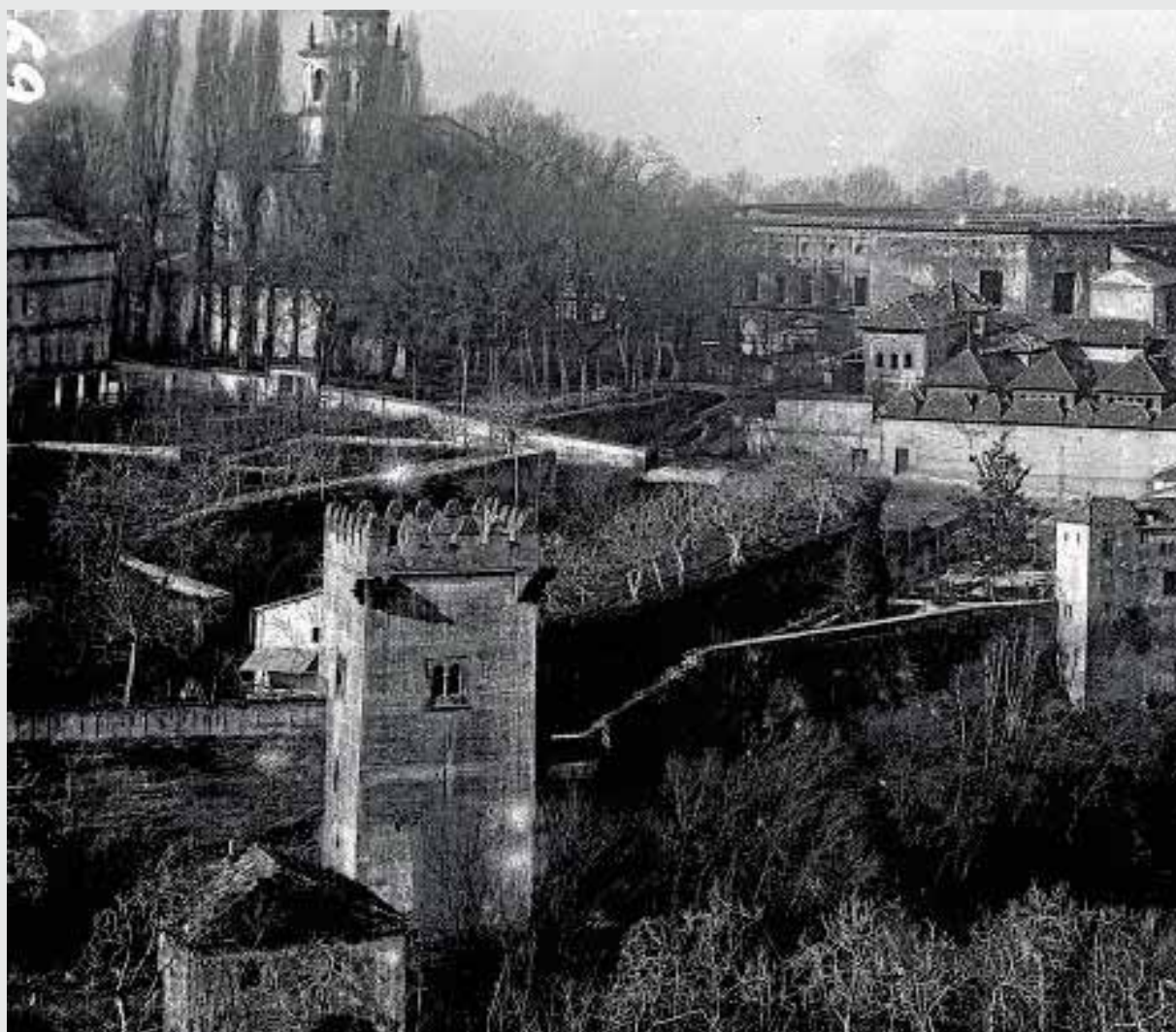
Impresionante vista de la Alhambra de la colección Thomas.