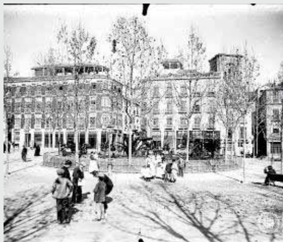
Plaza de la Trinidad.