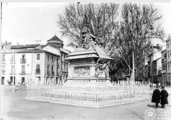
Monumento de Isabel la Católica en el Salón.