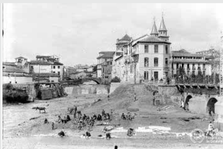
Mujeres lavan la ropa en el cauce del Genil.