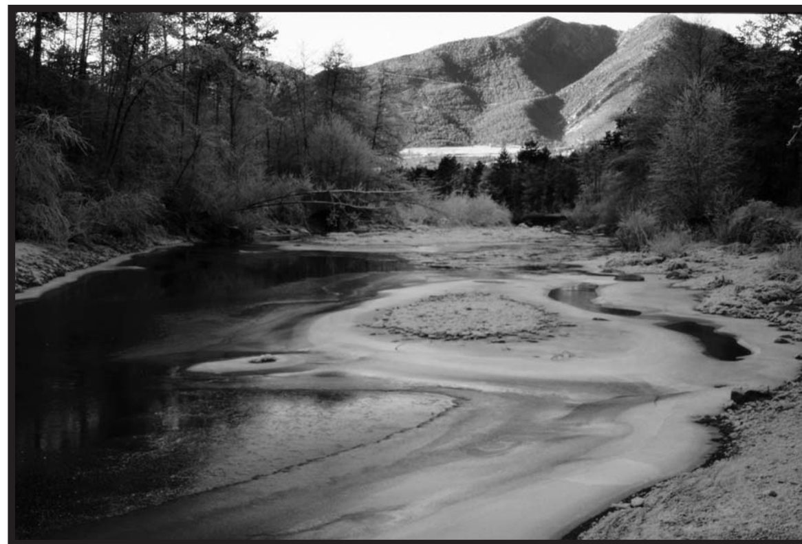
La Pobla de Lillet