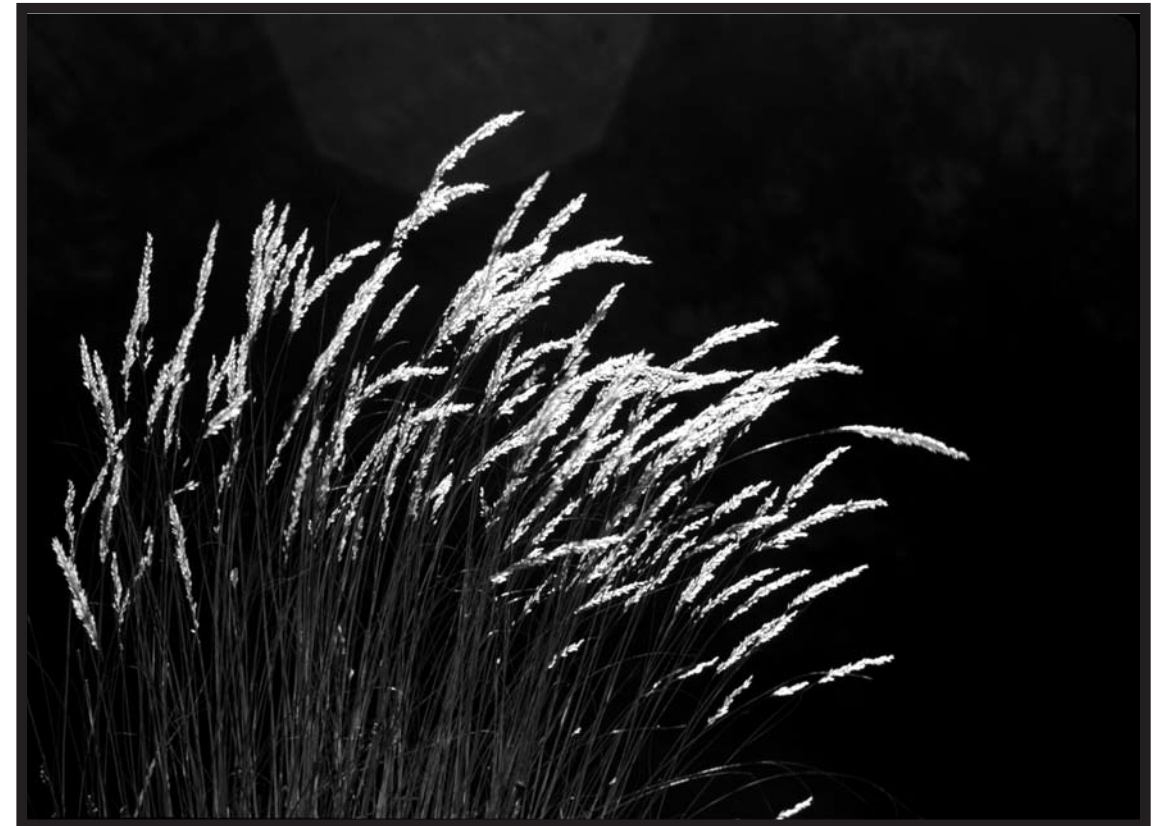
JOAN RIBERA I FORNELLS

Autobusos: 14, 41, 54, 59, 63, 66, 67, 68 metro: Línia 5, Hospital Clínic