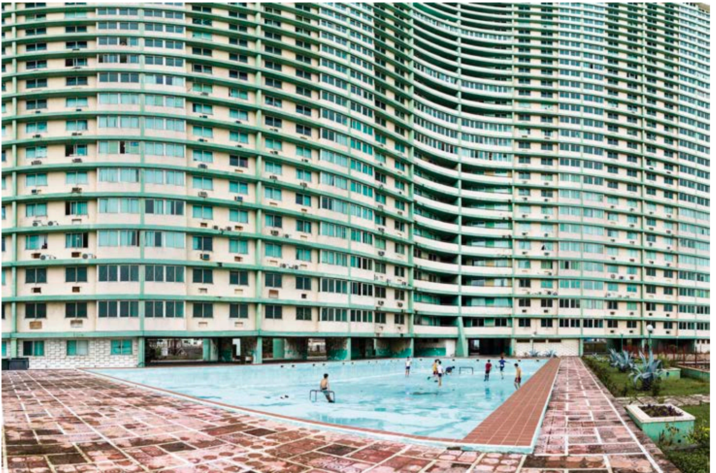
Fútbol en la piscina del Focsa (2015, La Habana. 225 x 150)