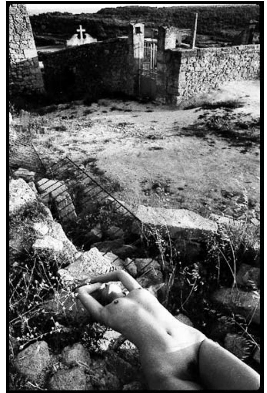
"LUMIÈRE DE LA VIE"