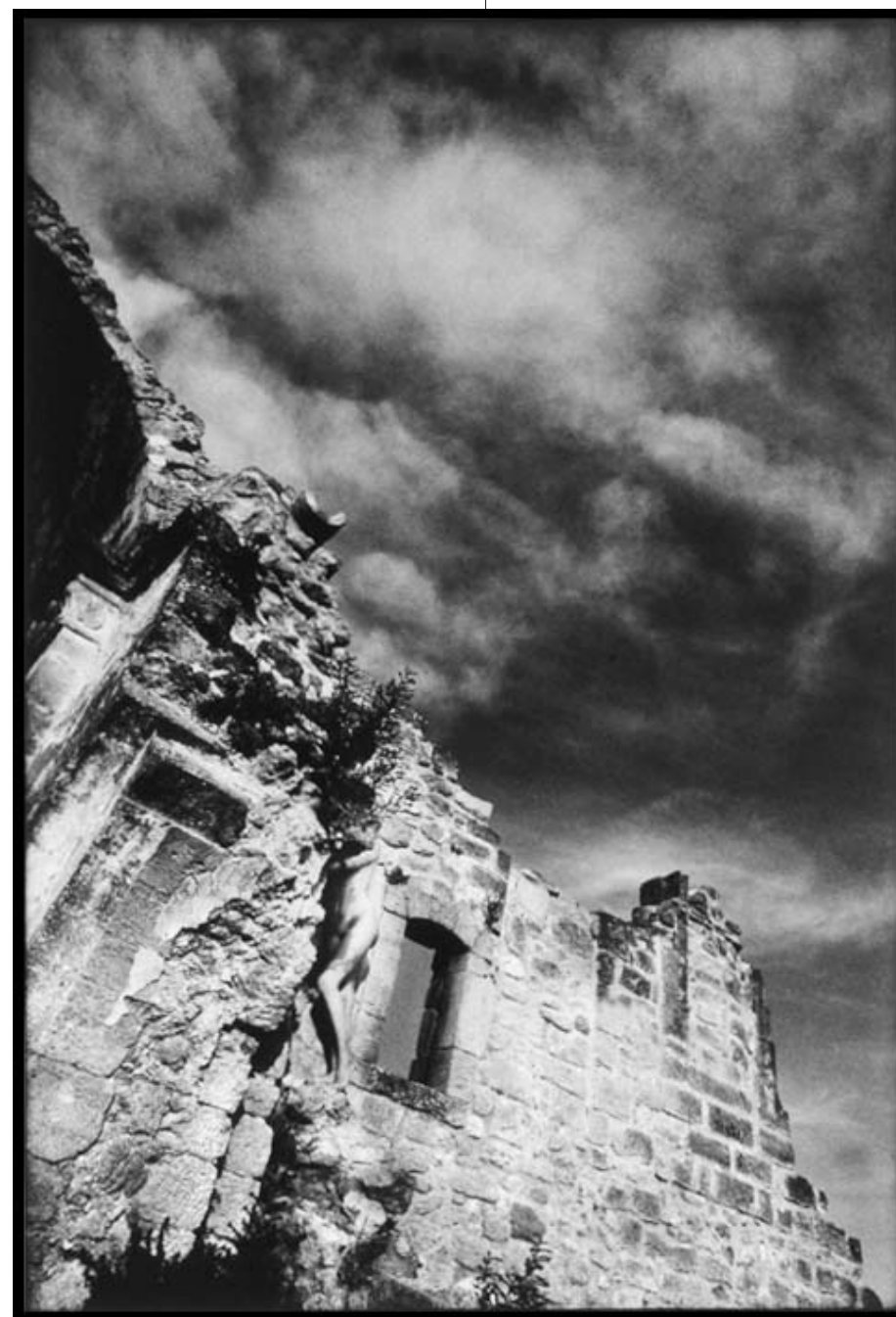
"UN LEZARD AU SOLEIL"