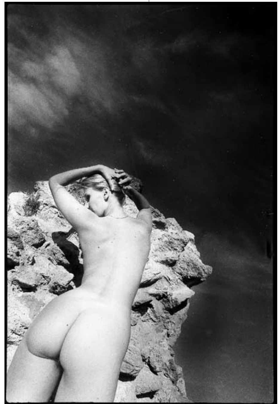
"... ET LA TEMPÊTE S'APAISE"