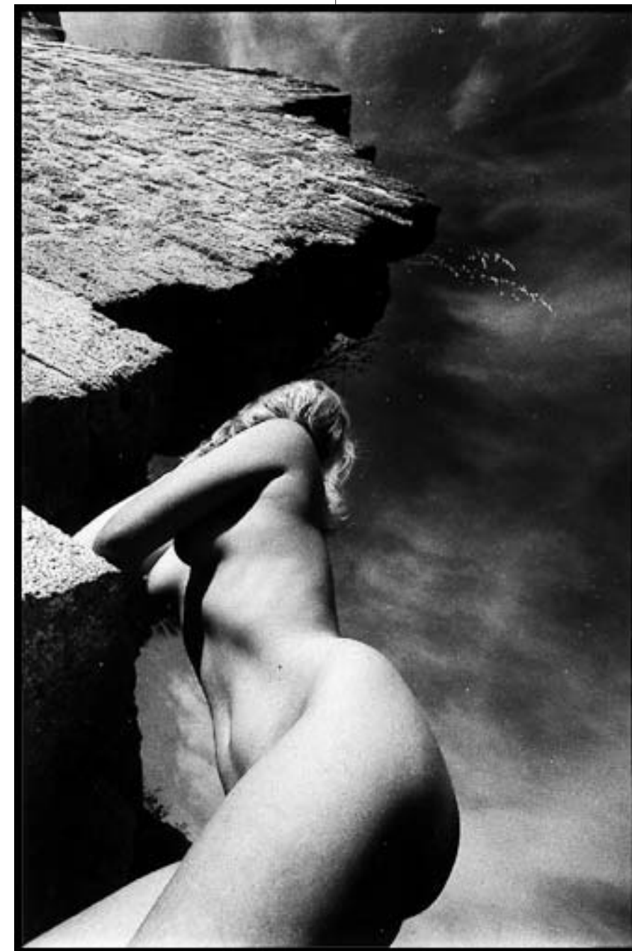
"LE MUR DE L'EXALTATION"