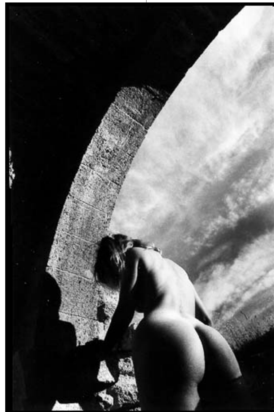
"LE MONDE SELON SANDRA"