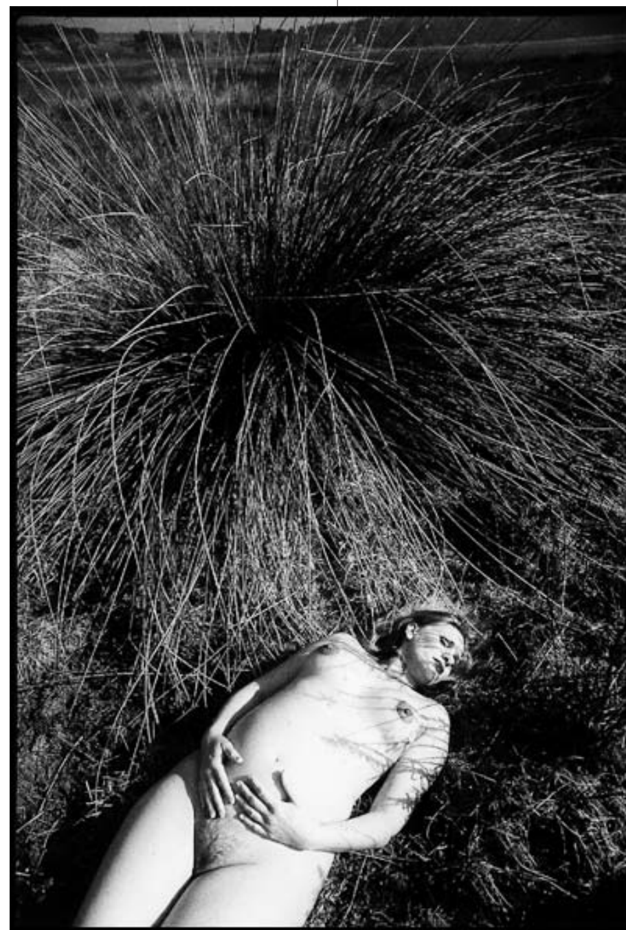
"VĒNUS METTRA AU MONDE"