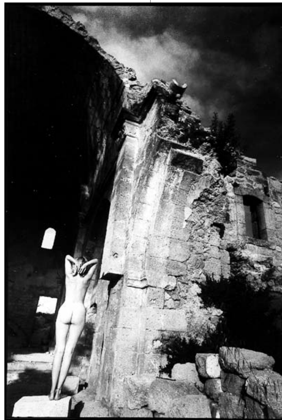
" EN TOUTE SIMPLICITÉ "