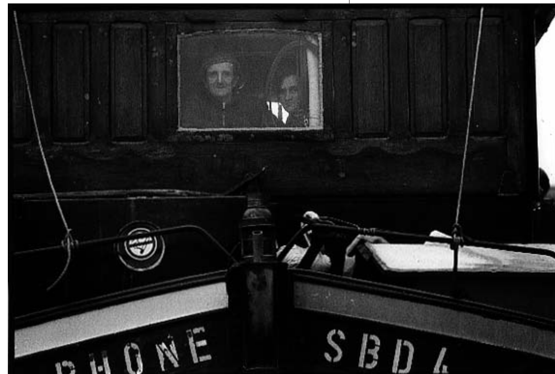
"Vitrine" (Dombasle, janvier 1987)