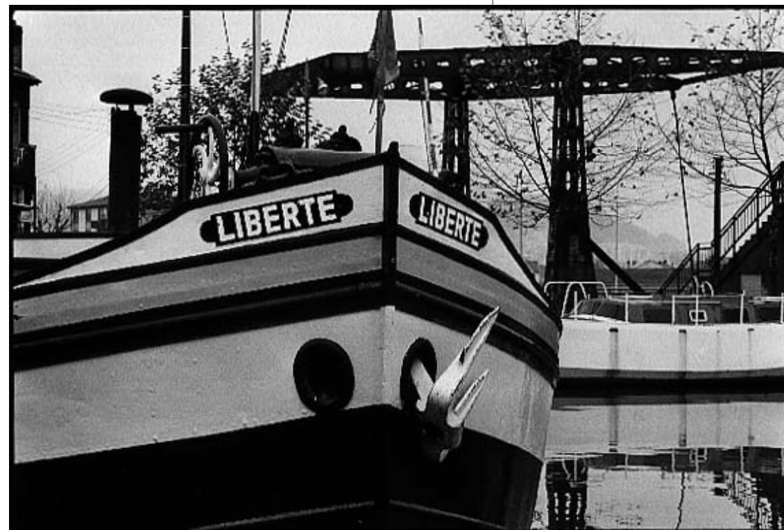
"Le poids de la liberté." (Nancy, Novembre 1987)