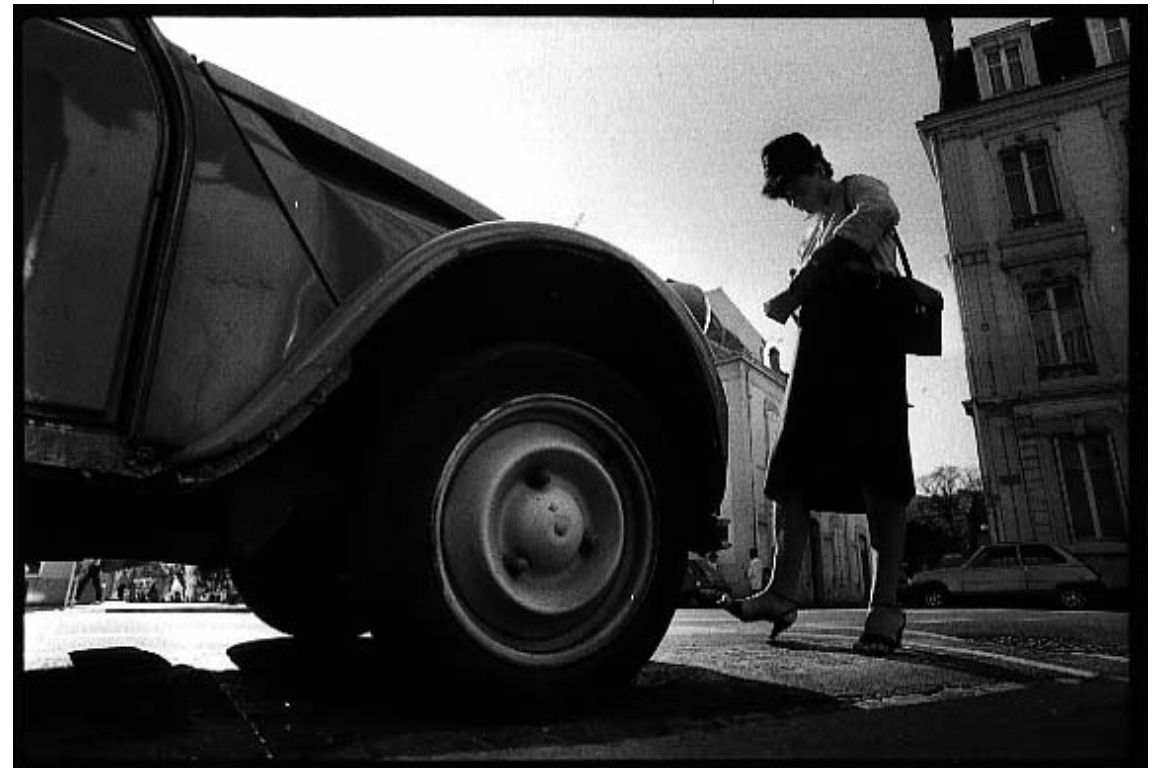
"Hostilité latente" - (Thionville - Septembre 1985)