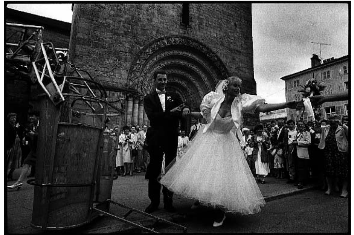
"Le vainqueur nuptial". (Epinal - Juin 1988)