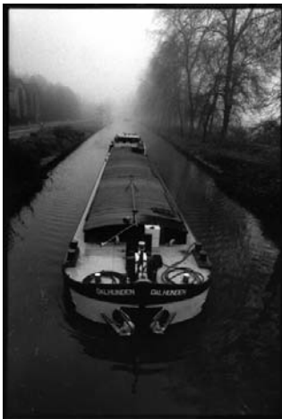
"Brume épaisse" - (Mangonville - ) décembre 1985)