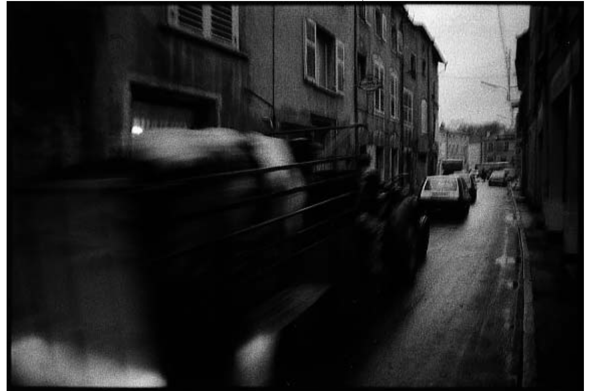
"Cortège funèbre". (Vézeliac. Novembre 1987)