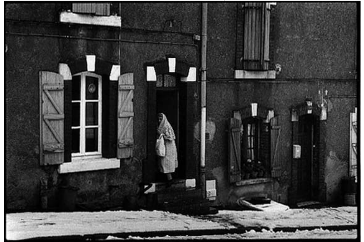
"Coquette arouée" - (Villerupt - Novembre 1987)