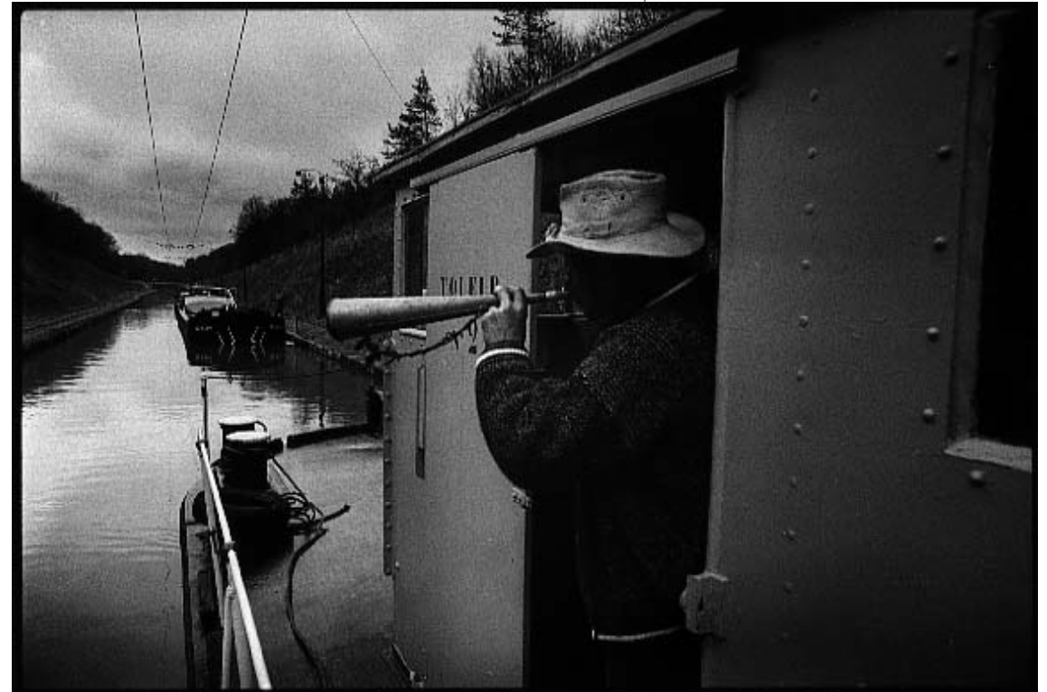
"Départ imminent" (Tunnel de Mauvages. Novembre 1987)