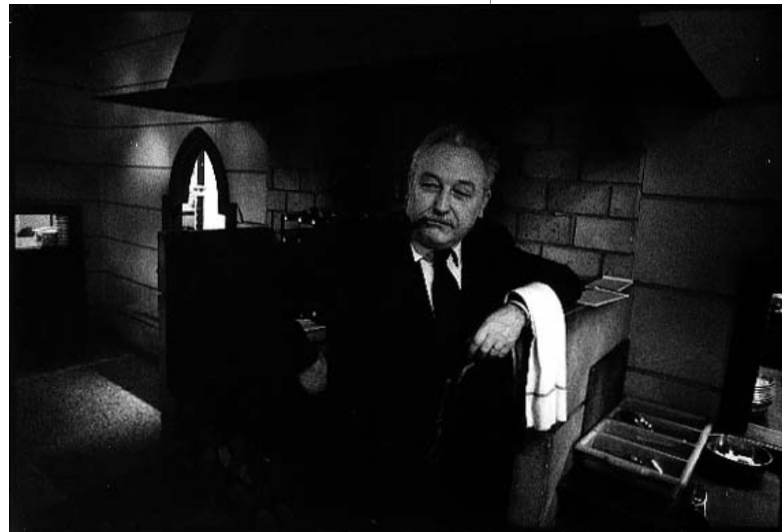
"Le beau parleur" - (Nancy - Janvier 1987)